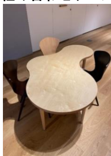
組み合わせテーブル1 2台

ミライエハウス周辺にある閲覧用テーブル及び椅子です。 使用の際は、備品使用計画票をご提出ください。