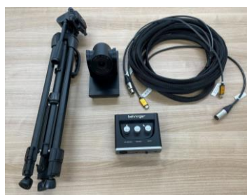
オンライン会議用機材