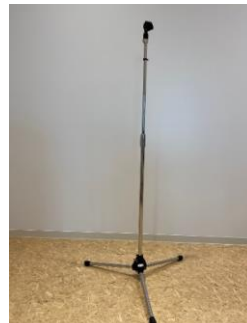
マイクスタンド(床型)