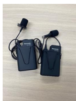
ワイヤレスマイク (タイピン型)