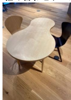
組み合わせテーブル2 2台