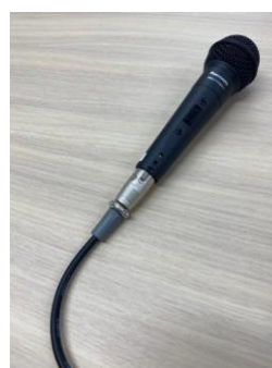
ダイナミックマイク