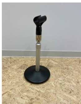
マイクスタンド(卓上型)