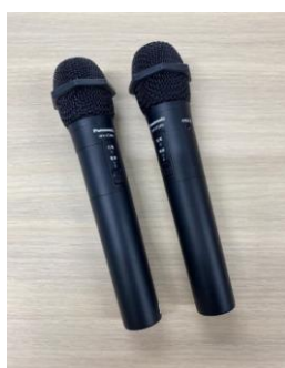
ワイヤレスマイク