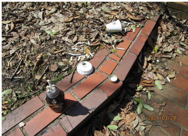
▲一般道から福利棟へ向かう階段脇