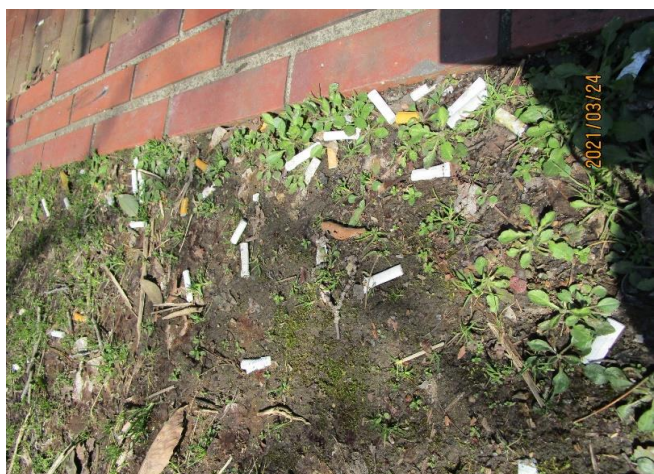
▲一般道から福利棟へ向かう階段脇②