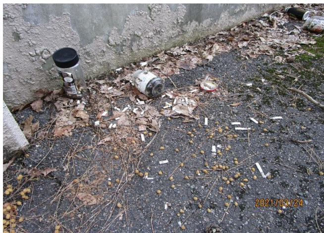
▲極限エネルギー密度工学研究センター2号棟裏①