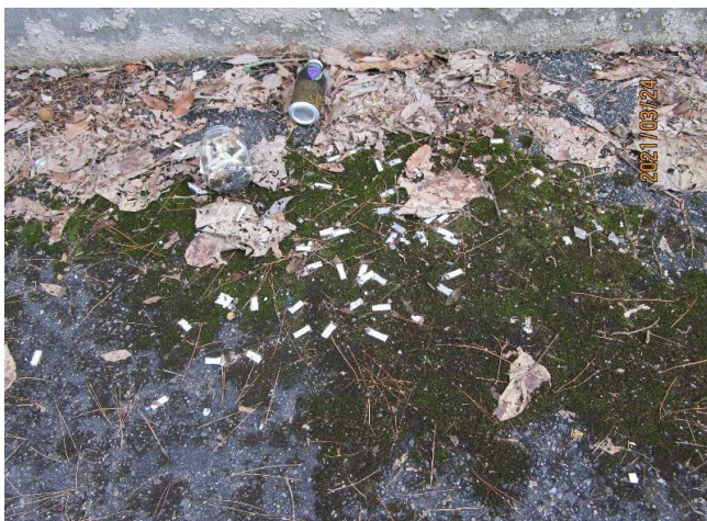
▲極限エネルギー密度工学研究センター2号棟裏②