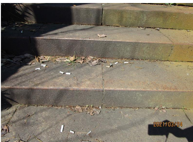
▲一般道から福利棟へ向かう階段