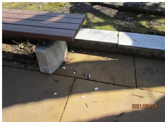
▲一般道から福利棟へ向かう途中にあるベンチ脇