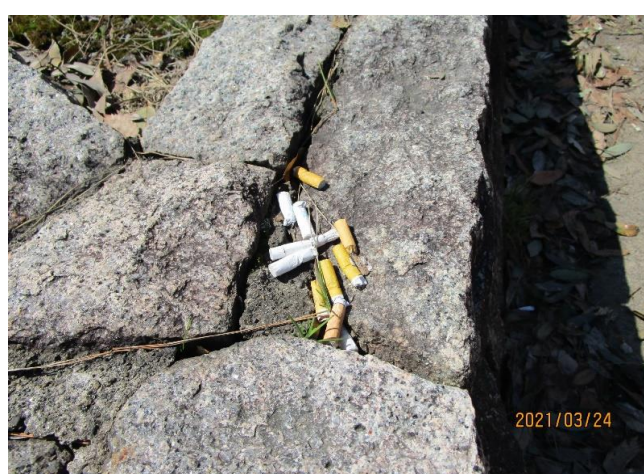
▲一般道に面した駐輪場脇