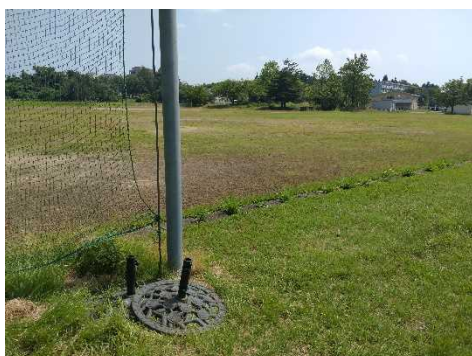
多目的グラウンド南

土台は、多目的グラウンドの写真の箇所に置いてあります。移動させて使用してもよいですが、使用後は元の場所に戻してください。