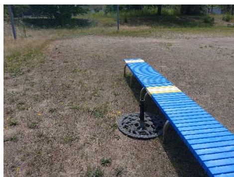
多目的グラウンド北